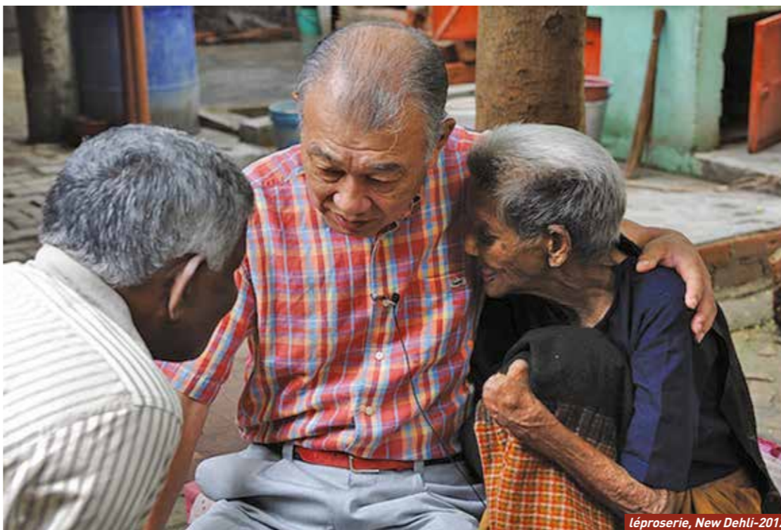
léproserie, New Dehli-2012

bulletin trimestriel - septembre 2015 - N°128